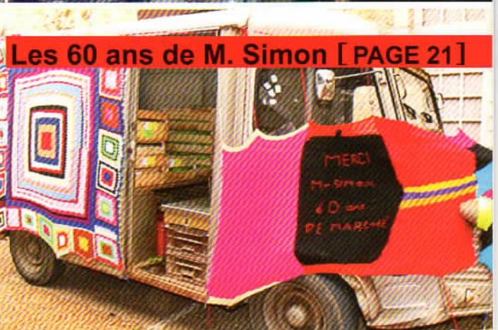
Les 60 ans de M. Simon [ PAGE 21 ]