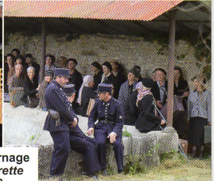
Tournage Laurette 1942